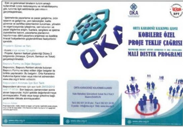
Mali Destek Programı Broşürü

tarihleri arasında Amasya, Çorum, Samsun ve Tokat 4 il merkezinde ve 16 ilçede toplam 20 adet olmak üzere gerçekleştirilmiştir. Eğitim toplantılarında her il için 2 ajans uzmanı olmak üzere toplam 8 uzman görev yapmıştır. Eğitimler için “Ek-T6 Eğitim Başvuru Formu” internet sitesinde ilan edilmiş ve katılımcılardan talep edilmiştir. Eğitim toplantıları 2 gün olarak planlanmış, uygulanmış ve sonunda katılımcılara Katılımcı Değerlendirme Anketi doldurulmuştur. Eğitimin konu başlıkları Mali Destek Programı, Proje, Mantıksal Çerçeve, Başvuru Formu, Bütçe ve Proje Döngüsü Eğitimi olarak belirlenmiştir. Eğitim faaliyetlerine TR 83 Düzey II bölgesinde Amasya'da 228, Çorum'da 245, Samsun'da 288 ve Tokat ilinde 280 olmak üzere toplam 1041 kişi katılmıştır.