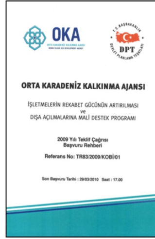
Mali Destek Programı Rehberi