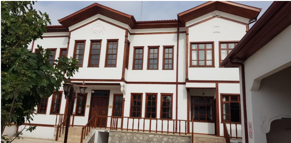
Şekil 4. Bilaller Konağının Mevcut Durumu

Program kapsamında uygulanan bazı projelerde, yapım ve/veya restorasyon faaliyetleri öngörüldüğü şekilde tamamlanmış olmakla birlikte program amaçlarına uygun olarak işlev kazandırılmadığı görülmüştür. Örneğin Bilaller Kültür ve Sanat Merkezi projesi kapsamında restore edilen tarihi konak, günümüzde bir kamu kurumunun idari hizmet binası olarak değerlendirilmektedir.