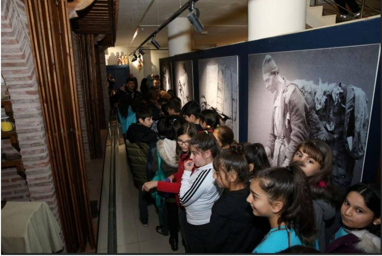
Şekil 17. Tokat Kent Müzesini Ziyaret Eden Çocuklar