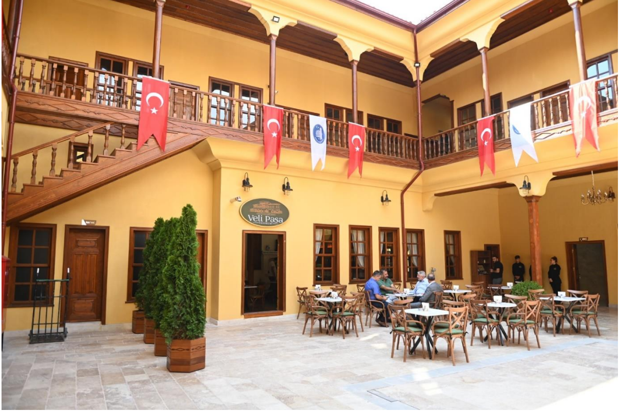
Şekil 11. Veli Paşa Hanı İç Avlusunun Mevcut Durumu