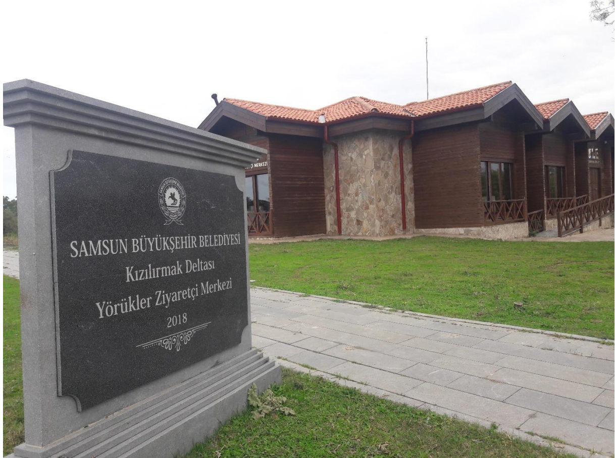
Şekil 13. Kızılırmak Deltası Ziyaretçi Karşılama Ünitesi

koruma bilincinin arttırılmasına yönelik kamusal etkinliklerin organizasyonlarında bu alana öncelik verilmesi gerektiği düşünölmektedir. Ayrıca yerel halkın projeyi sahiplenmesi ve kırsal turizm, doğa koruma ve yerel kalkınma arasındaki ilişkinin güçlendirilmesini teşvik edecek mikro ve küçük hibe programları uygulanması gerektiği düşünölmektedir.