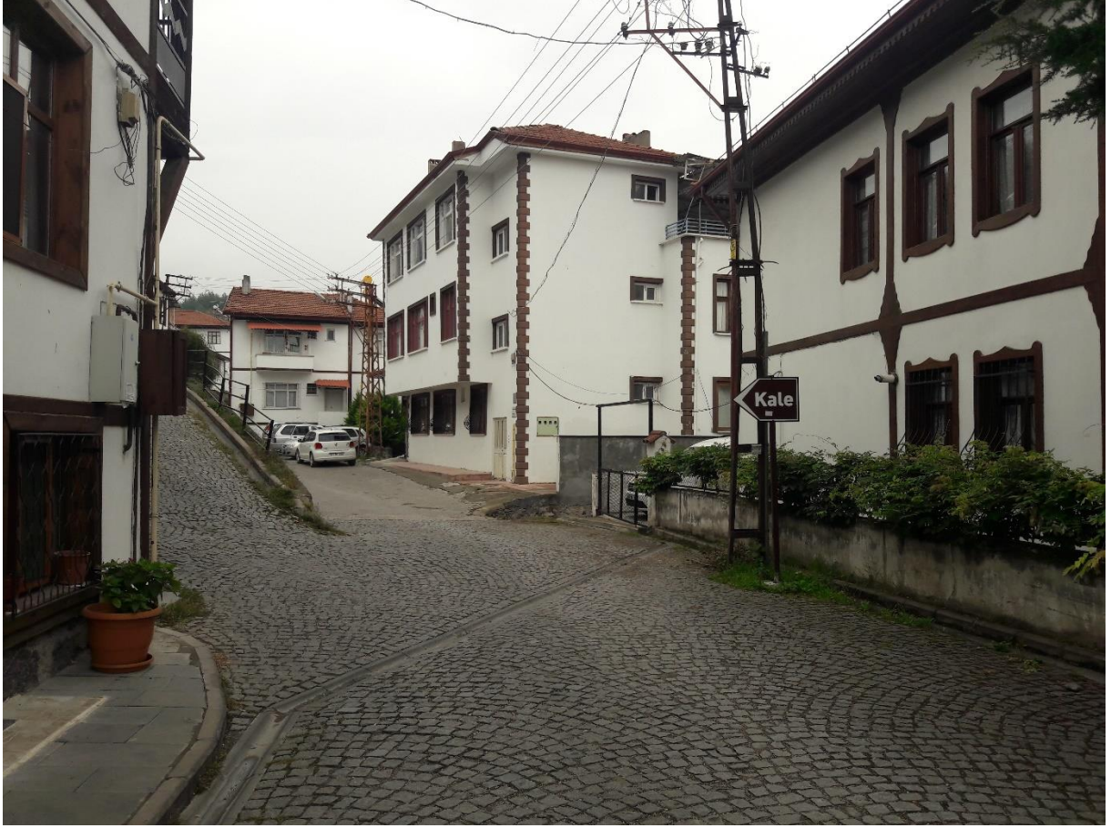
Şekil 6. Niksar Kaleiçi Akil Muhtar Erdem Sk.