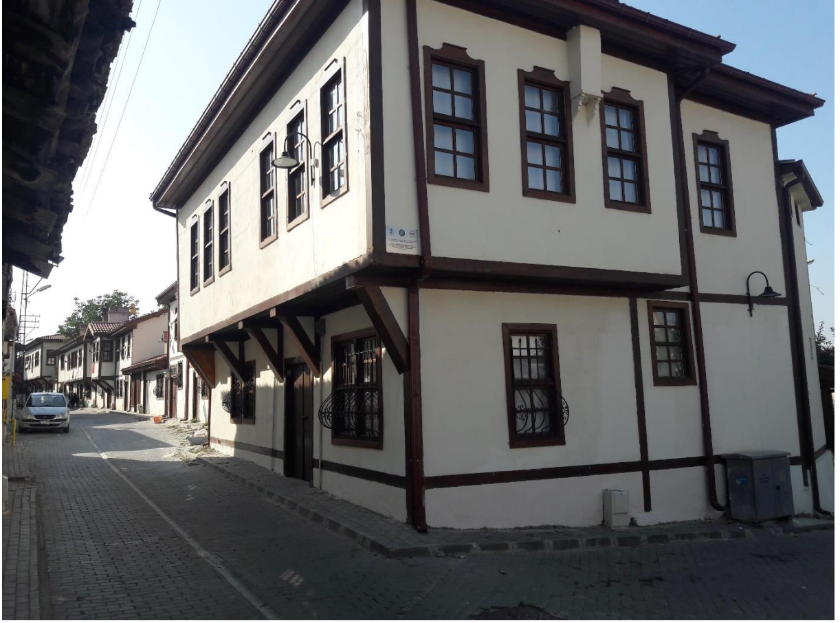
řekil 5. Vezirköprü İlçesi Proje Uygulama Alanının Mevcut Durumu

Saęlıklaştırma Projesi (Tokat-Merkez), Amasya Caddesi Sokak Saęlıklaştırması (Tokat-Zile) ve Niksar Tarihi Kaleiçi Mahallesi Sokakları Özgünleřtirme Projesi (Tokat-Niksar)'dir.