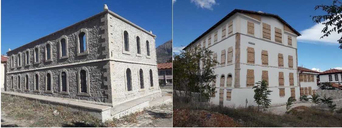
Şekil 3. İskilip Redif Kışlası ve Merzifon Kızlar Mektebi Binalarının Mevcut Durumu

restorasyon aşamasında artan maliyetlerin başvuru sahibi ve ortakları tarafından karşılanamaması sebebi ile yarım kalmıştır. Her iki yapının restorasyonunun tamamlanarak hizmete açılabilmesi için yerel paydaşlar ve Kültür ve Turizm Bakanlığı başta olmak üzere ulusal paydaşlar ile temaslar kurulduğu yapılan saha ziyaretlerinde değerlendirme ekibine bildirilmiştir.