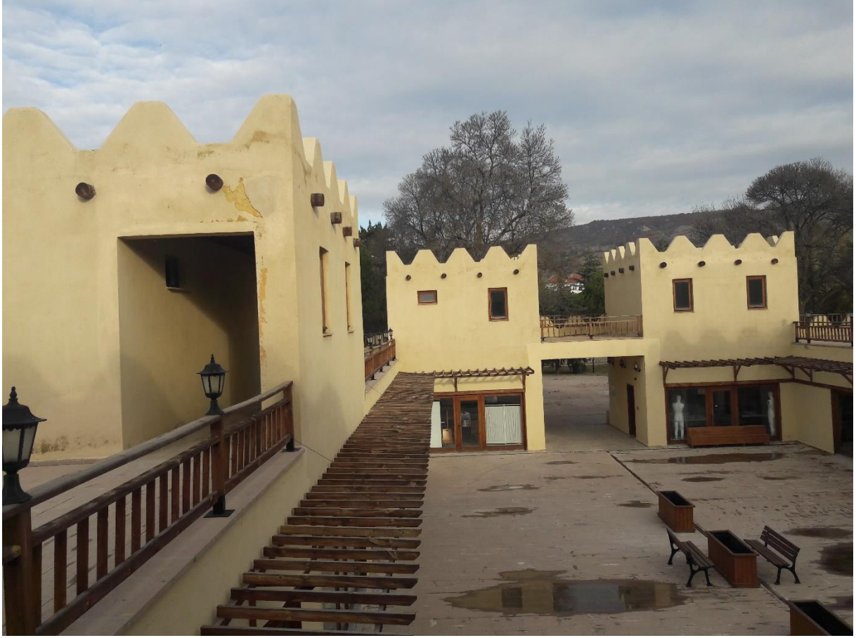
Şekil 12. Hitit Köyü projesi kapsamında inşaa edilen yapının mevcut durumu

kullanımının hedeflendiği görülmüş ve bu durum olumlu değerlendirilmekle birlikte bu yaklaşımın araştırma dönemi itibari ile sonucu beklenen düzeyde değildir.