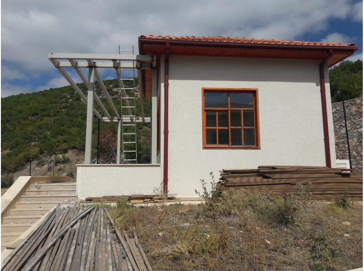
Şekil 14. Güdümlü Proje Desteği kapsamında tadilata Alman Yapılar

Vezirköprü Şahinkaya Kanyonu Dinlenme Tesisi Projesi kapsamında yapım işi tamamlanan restaurant Samsun Büyükşehir Belediyesi Anakent Turizm A.Ş. tarafından işletilmekte olup Şahinkaya Kanyonu bölgesinde hizmet sunum kalitesinde öne çıkan tek tesis konumundadır.