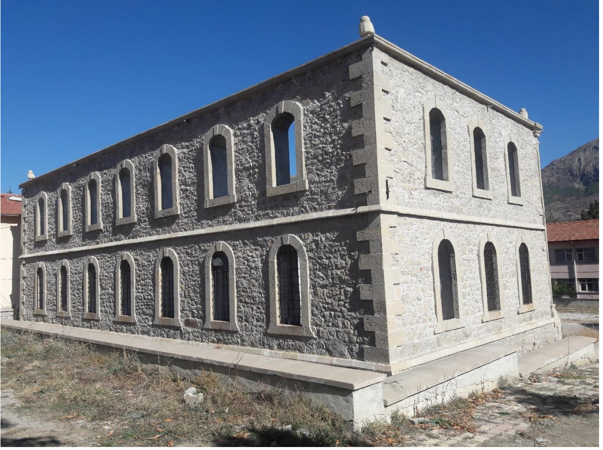
Şekil 8. İskilip Redif Kışlasının Mevcut Durumu

Merzifon Kızlar Mektebi projesi kapsamında restorasyonu yarım kalan tarihi yapının etrafı güvenlik amacı ile çevrilmiş olmakla birlikte yapı bahçesine ve içerisine çeşitli yerlerden girişler olduğu görülmüş ve bu durum yangın (iç kısımda ateş yakıldığı görülmüştür) vb. riskler oluşturduğu için yetkililere bildirilmiştir. Mevcut restorasyonun tamamlanmaması durumunda mevcut yapının zaman içerisinde korunamaması riski yüksek olarak görülmektedir.