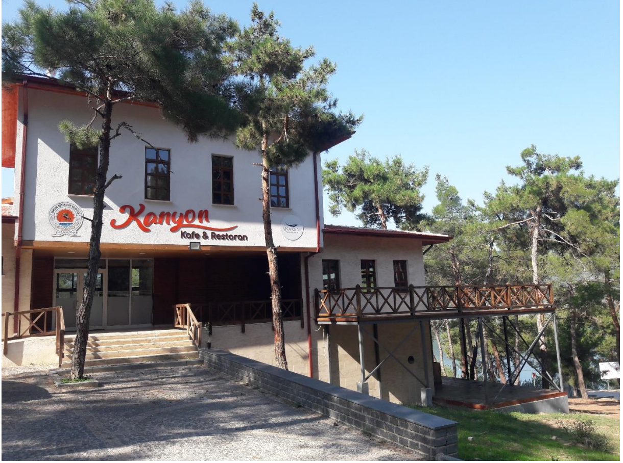
Şekil 15. Vezirköprü Şahinkaya Kanyonu Kanyon Kafe-Restoran Tesisi

Tesisin işletilmesi ile ilgili sorun görülmemiştir. Başvuru sahibi tarafından ziyaretçi sezonu boyunca aktif olarak hizmet sunulduğu beyan edilmiştir.