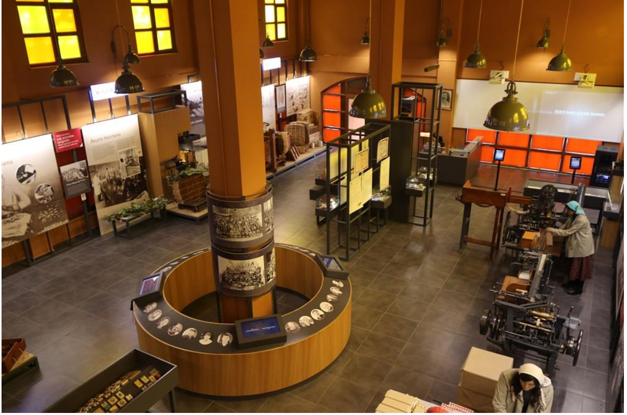
Şekil 16. Bafra Tütün Müzesi İç Kısmından Görünüm

Tokat Kent Müzesi projesi kapsamında kurulan müze; kentin en önemli tarihi sokaklarından olan Sulusokak üzerinde bulunmakta olup başvuru sahibi Tokat Belediyesi tarafından işletilmektedir. Müzenin operasyonel sürdürülebilirliği ile ilgili herhangi bir risk bulunmadığı değerlendirilmektedir. Diğer yandan, müzenin bulunduğu nokta Orta Karadeniz Kalkınma Ajansı tarafından ve ildeki diğer ilgili paydaşlar tarafından finanse edilen turizm odaklı birçok projeye ev sahipliği yapmakta olup sonuç ve etkilerin sürdürülebilirliği ve çarpan etkisi açısından olumlu değerlendirilmektedir.