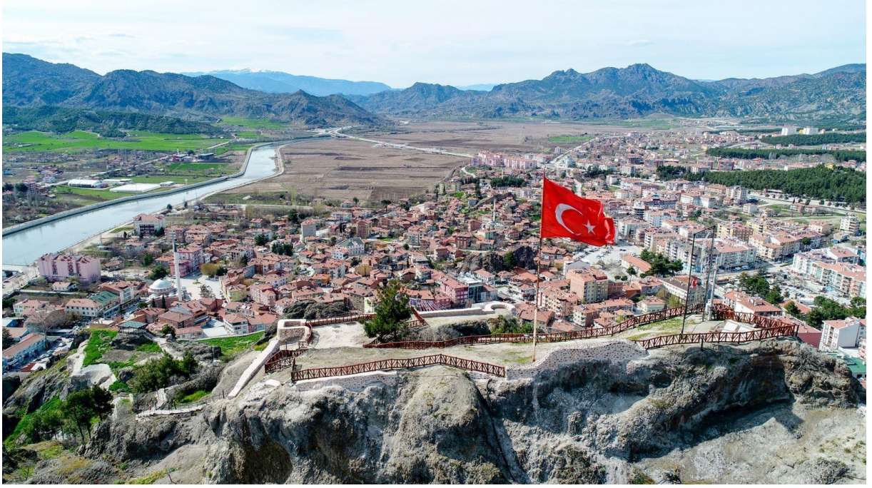
Şekil 7. Osmancık Kandiber Kalesinin Havadan Görünümü