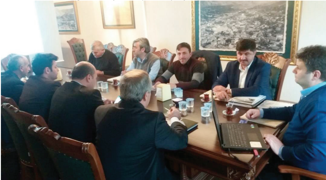
Şekil 3- İlgili Kuruluşlarla Yapılan Paydaş Toplantılarından Görünüm