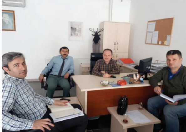
Şekil 4- Kurum Ziyaretleri