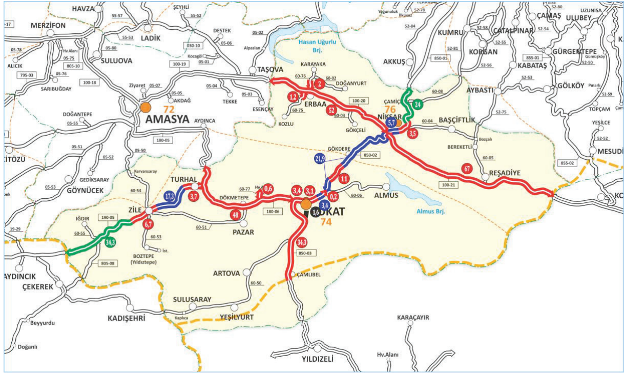
Şekil 2- Tokat'taki Bölünmüş Yollar Haritası

Tokat il merkezinin batıyla bağlantısını sağlayan yol, Turhal ilçesi üzerinden Amasya'ya uzanan D180 yoludur. Bu yolda bir süredir bölünmüş yola çevirme çalışmaları devam etmektedir. Tokat il merkezinin batıyla bağlantısını sağlayan bir diğer yol ise Turhal ve Zile ilçeleri üzerinden Alaca ve Çorum'a bağlanan D190 yoludur. Bu yolun mevcut standartları oldukça düşük olup, iyileştirme çalışmaları devam etmektedir. Yatırım programlarında "Sungurlu/Çorum Ayrımı - Boğazkale Ayrımı -Alaca/Çekerek Ayrımı - Zile/Turhal" yolu olarak geçen 159 km uzunluğundaki bu yolun 2021 yılında bitirilmesi planlanmaktadır.