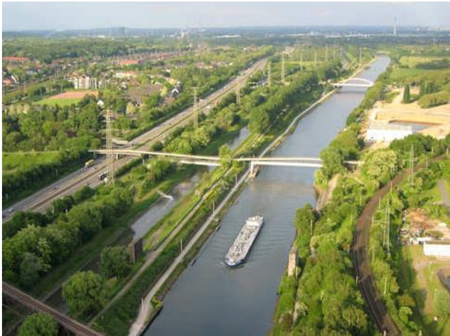
Dönüşümden sonra Ruhr Bölgesi