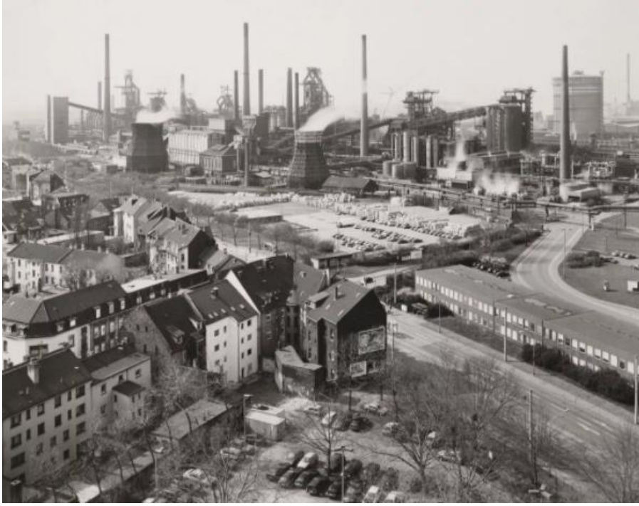
Dönüşümden önce Ruhr Bölgesi