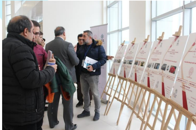
Şekil 4: Mesleki ve Teknik Liseler Proje Pazarı