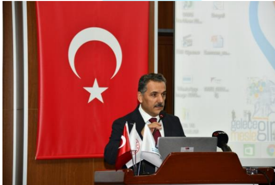
Şekil 1: OKA "Gelecekte İş" Konferansı Programı