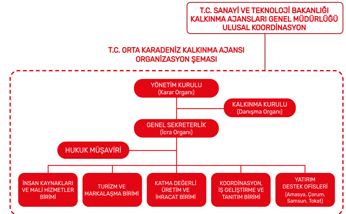
Şekil 1: Orta Karadeniz Kalkınma Ajansı Teşkilat Yapısı

Orta Karadeniz Kalkınma Ajansı'nın teşkilat yapısı Şekil 1'de verilmektedir.