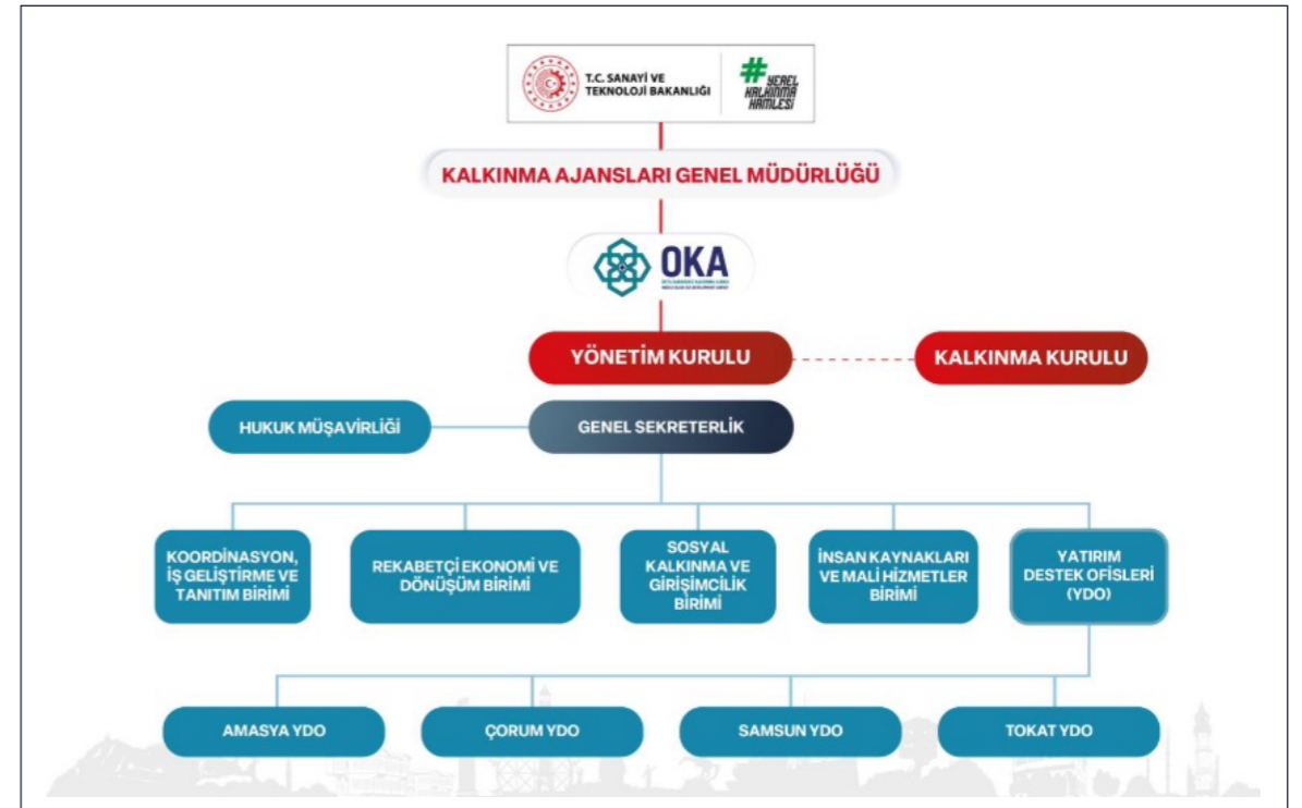
Şekil 2: Orta Karadeniz Kalkınma Ajansı Teşkilat Yapısı

Orta Karadeniz Kalkınma Ajansı'nın teşkilat yapısı Şekil 2'de verilmektedir.