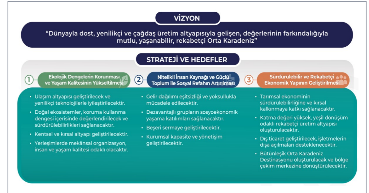
Şekil 3: TR83 2024-2028 Bölge Planı Vizyonu, Stratejik Öncelikleri ve Hedefleri

Bölge potansiyelinin harekete geçirilmesi hedefiyle, On İkinci Kalkınma Planı, Orta Vadeli Program (2024-2026) ve Bölgesel Gelişme Ulusal Stratejisi doğrultusunda hazırlanan TR83 Bölgesi 2024-2028 Planı, 16 Aralık 2024 tarih ve 9253 sayılı Cumhurbaşkanlığı Kararı ile onaylanarak yürürlüğe girmiştir. Ajans politikaları ve öncelikleri TR83 Bölgesi 2024-2028 Planı çerçevesinde belirlenmektedir. Planda bölgenin kalkınma vizyonu "Dünyayla dost, yenilikçi ve çağdaş üretim altyapısıyla gelişen, değerlerinin farkındalığıyla mutlu, yaşanabilir, rekabetçi Orta Karadeniz" olarak belirlenmiştir. Bu vizyon çerçevesinde belirlenen 3 stratejik öncelik ve 12 hedef aşağıdaki gibidir: