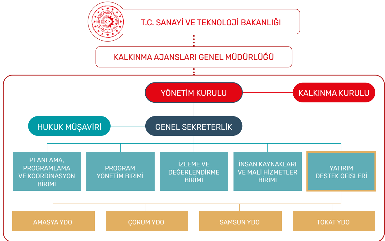
Şekil 1 Orta Karadeniz Kalkınma Ajansı Teşkilat Yapısı

Bu doğrultuda Orta Karadeniz Kalkınma Ajansı'nın teşkilat yapısı aşağıdaki şekildedir.