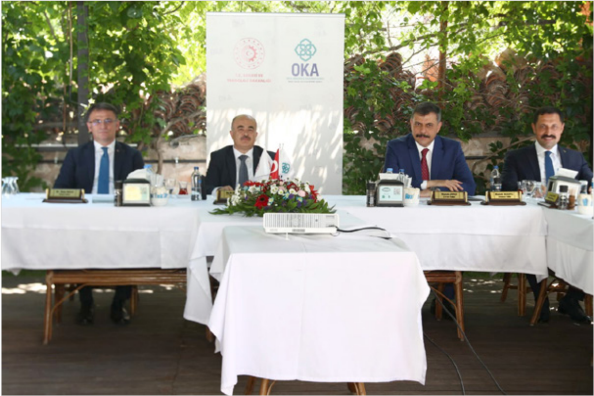
Fotoğraf 2 Orta Karadeniz Kalkınma Ajansı Yönetim Kurulu Toplantısı