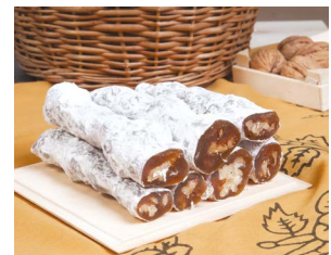
Tokat Zile Kömesi