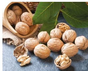
Tokat Niksar Cevizi