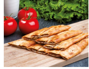
Samsun Çarşamba Pidesi