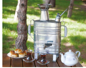
Samsun Vezirköprü Semaveri