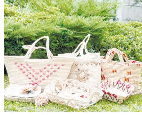
Samsun Bafra Zembili