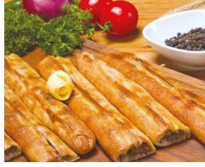
Samsun Bafra Pidesi