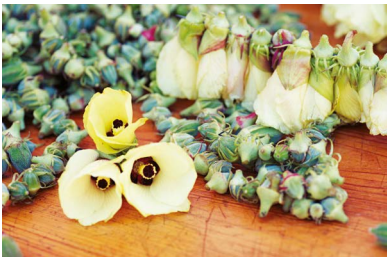
Amasya Taşova Çiçekbamyası

Amasya'nın; Amasya Balı, Amasya Erikli Kuzu Eti, Amasya Hünnapı, Amasya Hünnap Pekmezi, Amasya Sa-