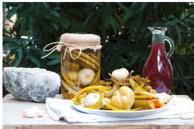
Çorum İskitip Turşusu