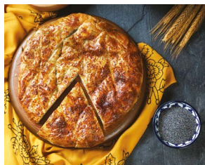
Tokat Turhal Yoğurtmacı