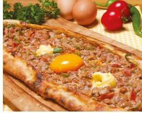
Samsun Terme Pidesi