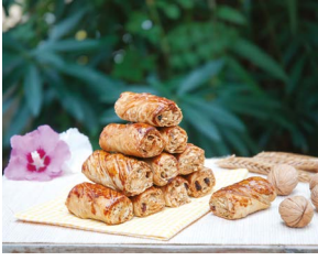
Samsun Bafra Nokulu