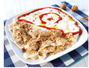
Samsun Yakakent Mantısı

kala Çarpan Çorbası, Amasya Çatal Çorbası, Amasya Çatal Çorbası, Amasya Şehzade Kebabı, Gediksaray Dokuması, Gümüşhacıköy Haşhaşlı Saçüstü, Kaypak (Piruhi), Merzifon Dokuması, Merzifon Karası Üzümlü, Merzifon Kuşburnu Marmelatı, Suluova Et, Taşova Ekmeği (Delikli Ekmek/Halkalı Ekmek), Unutma Beni Tatlısı, Yassıçal Çuha Dokuması, Ziyaret Köy Ekmeği, Ziyaret Sini Çöreği, Ziyaret Yer Çöreği'nden oluşan 22 tane daha ürünün için coğrafi işaret tescil başvurusu bulunmaktadır.