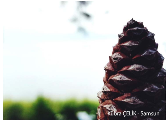
Kübra ÇELİK - Samsun