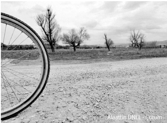
Alaattin ÜNEL - Çorum