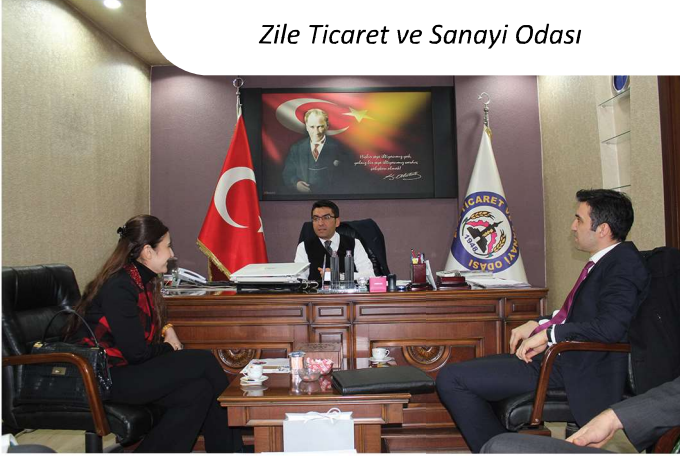
Zile Ticaret ve Sanayi Odası

Bölgede işbirliği geliştirme ve koordinasyon ziyaretleri kapsamında 15.01.2019 tarihinde Zile ilçesinde Zile TSO ile Sebat Makina , Sesveren Makina , Özkaleli Gıda firmaları ziyaret edilmiştir. İlçe ve kurumların durumları hakkında bilgi edinilip önümüzdeki süreçte yapılacak işbirlikleri konusunda görüş alışverişinde bulunulmuştur.