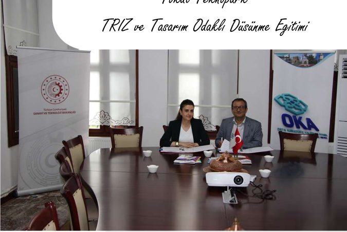
Tokat Teknopark TRIZ ve Tasarım Odaklı Düşünme Eğitimi