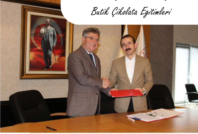
Samsun Büyükşehir Belediyesi Batık Çikolata Eğitimleri