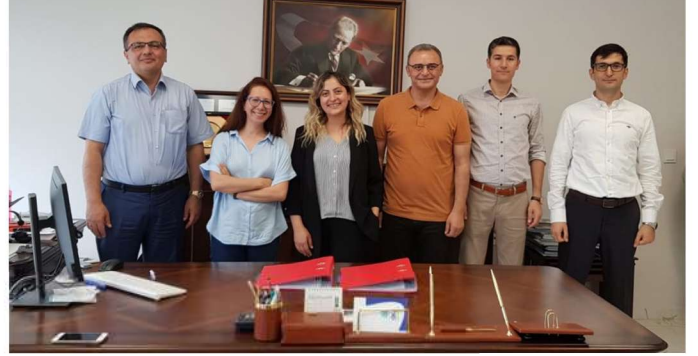
Hitit Uygarlığı Uygulama Araştırma Merkezi Çorum Endüstriyel Mirasının Tespiti ve Belgelemesi