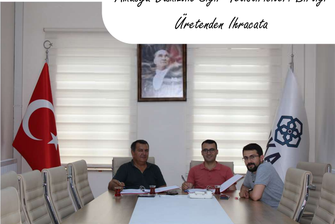
Amasya Damızlık Sığır Yetisttiricileri Birliğı Üretenden İhracata