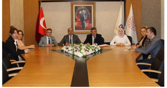
Samsun İl Sağlık Müdürlüğü Kurumsal Kimliğin Çışlendirilmesi İçin Aday Memur Eğitimcileri Yetisttirilmesi