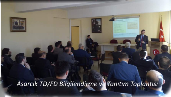
Asarcık TD/FD Bilgilendirme ve Tanıtım Toplantısı