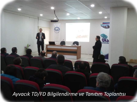
Ayvacık TD/FD Bilgilendirme ve Tanıtım Toplantısı