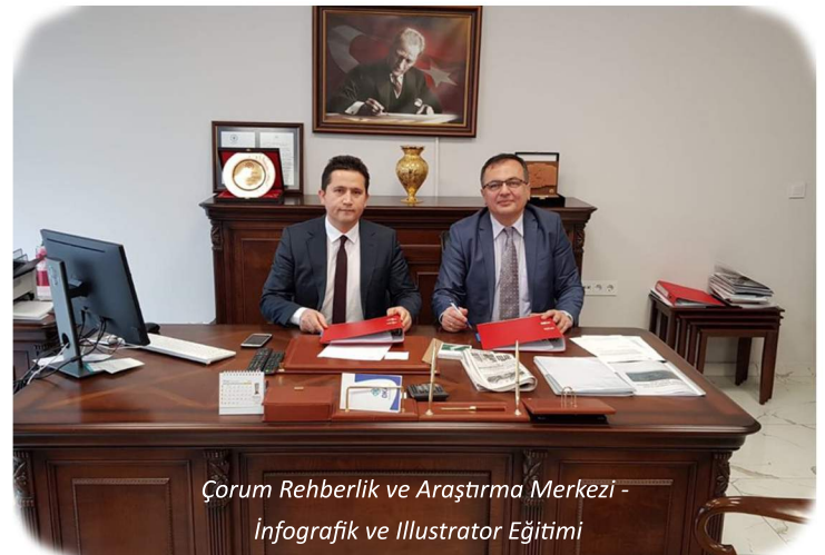
Çorum Rehberlik ve Araştırma Merkezi - Infografik ve İllustrator Eğitimi

Destek talebi hazırlayarak, Teknik Destek Programımıza başvuruda bulunan tüm proje ekiplerine teşekkür ediyor; sağlanacak desteklerin başvuru sahiplerinin kurumsal kapasitelerini artırmasını ve bölgemizin kalkınmasına katkıda bulunmasını temenni ediyoruz.