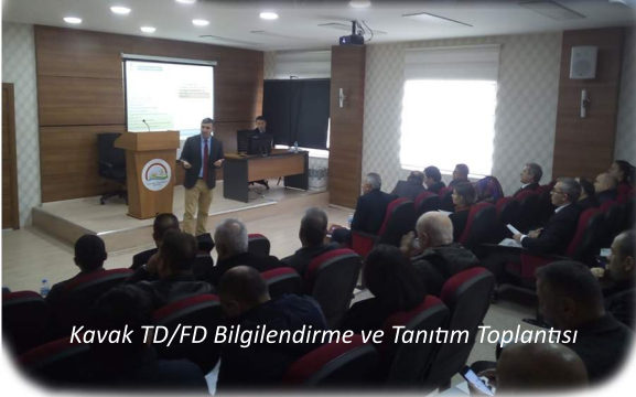
Kavak TD/FD Bilgilendirme ve Tanıtım Toplantısı

Ajansımız 2019 yılı içerisinde uygulanmak üzere duyurusunu yaptığı teknik destek ve fizibilite desteği programlarına ilişkin Bölge genelinde bilgilendirme ve tanıtım toplantıları düzenlemektedir.