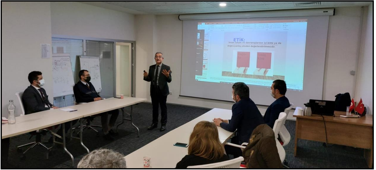
Fotođraf 2 - 16.12.2021 tarihli eđitim.