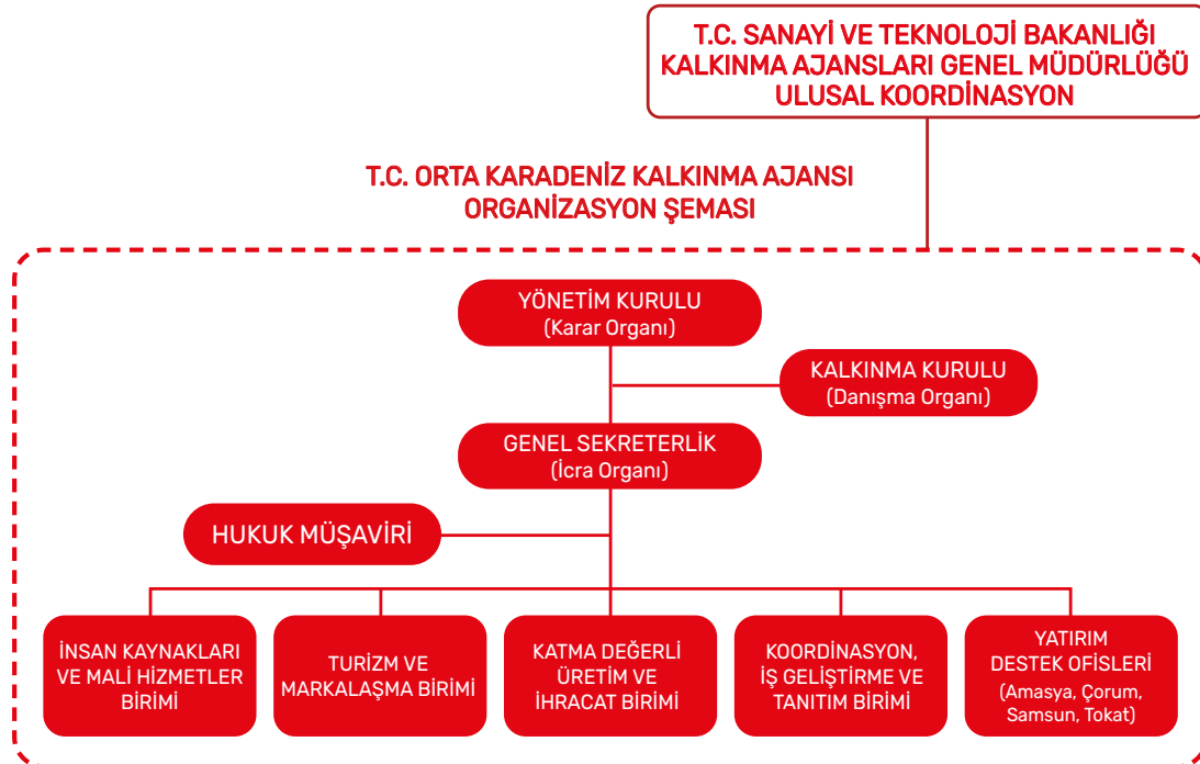
Şekil 1 Orta Karadeniz Kalkınma Ajansı Teşkilat Yapısı

Bu doğrultuda Orta Karadeniz Kalkınma Ajansı'nın teşkilat yapısı aşağıdaki şekildedir.