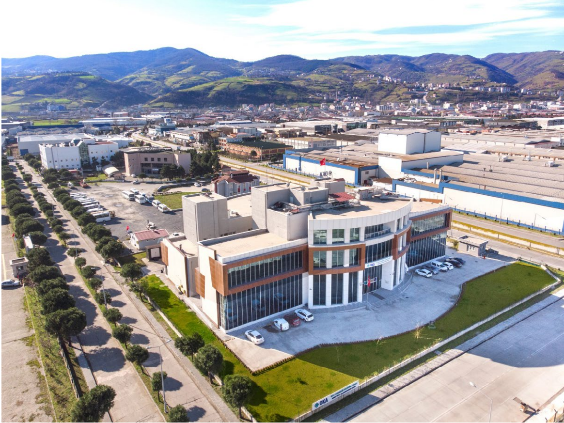
Fotoğraf 1 Orta Karadeniz Kalkınma Ajansı, Merkez Hizmet Binası, Samsun

Hizmet binası, yaklaşık 7.000 m 2 kapalı alan ve 1.800 m 2 çevre düzenlemesini içermektedir. Binada, Ajans çalışanlarının odalarının yanı sıra 3 adet eğitim salonu, 2 adet toplantı salonu ve 250 kişilik konferans salonu yer almaktadır.