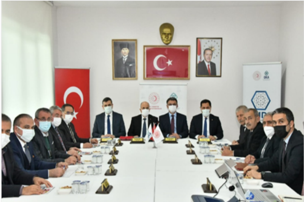
Fotoğraf 2 Orta Karadeniz Kalkınma Ajansı Yönetim Kurulu Toplantısı