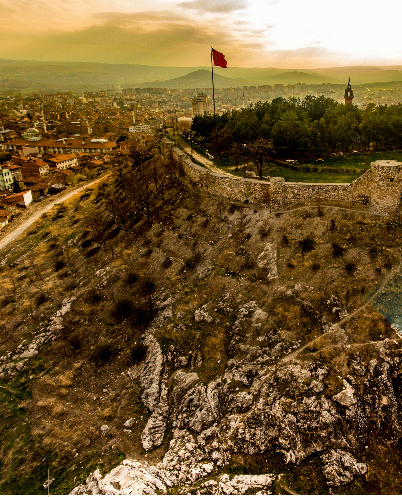
Tokat, Zile Kalesi