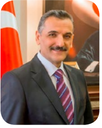
Osman KAYMAK Samsun Valisi

Orta Karadeniz Bölgesi'nin merkezinde yer alan Samsun, Türkiye ekonomisinin son yıllarda gösterdiği performans neticesinde, sahip olduğu iş gücü, coğrafi konumu ve yüzyıllardan beri ticaret, sanayi ve ulaştırma konusunda edindiği bilgi birikimi ile ulusal ve uluslararası yatırımlar için önemli bir cazibe merkezi haline gelmiştir.