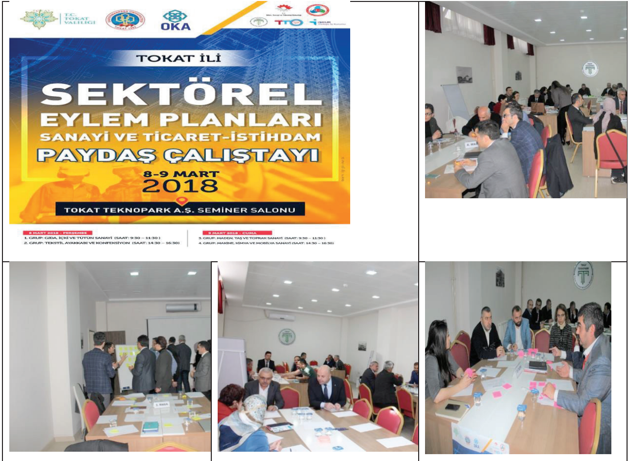
Şekil 2.Sektörel Eylem Planı Çalıştayı

şeklinde. İlk çalıştay 8-9 Mart 2018 tarihinde Gaziosmanpaşa Üniversitesi Teknoloji Transfer Ofisi koordinasyonunda Tokat Teknoparkta gerçekleştirilmiştir.