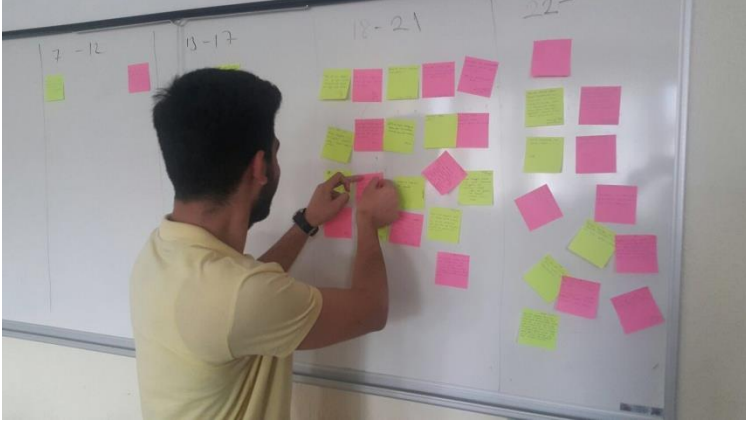
Resim 1. Yazı tahtasına post-itlerin yapıştırılması